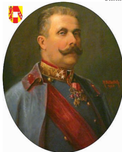
František Ferdinand Karel Ludvík Josef Maria arcivévoda Rakouský - Este (18. 12. 1863 - 28. 6. 1914)