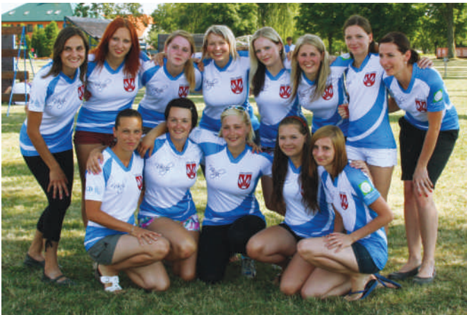
Tým žen Desné A v nových dresech