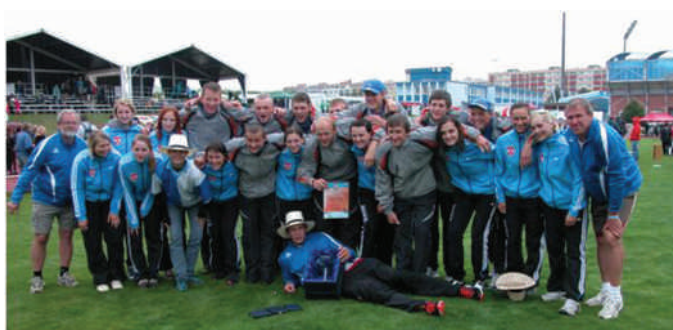
S mistry ČR v požárním sportu SDH Široký Důl