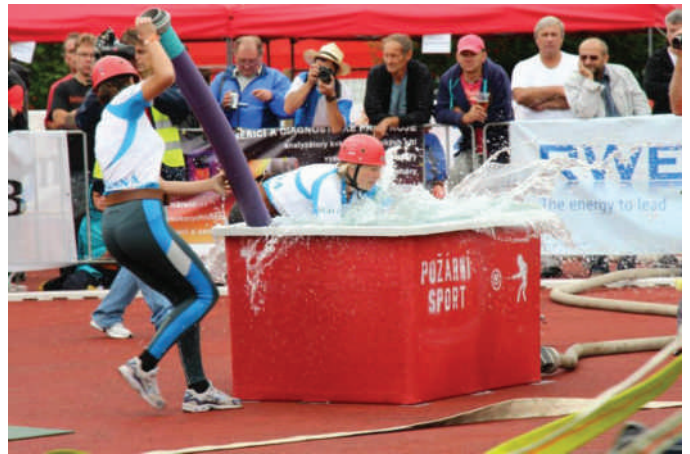
Tým žen Desné A v akci