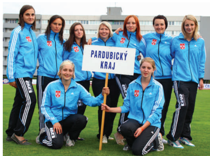
Reprezentace žen Pardubického kraje