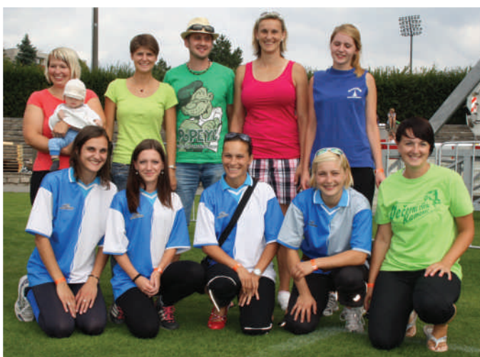
Žena s nejširšími rameny je Barbora Špotáková, olympijská vítězka z LOH v Londýně a LOH v Pekingu, byla přítomna na MČR s manželem - profesionálním hasičem.