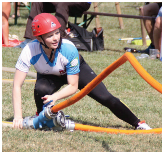
Zkrocení zlé hadice