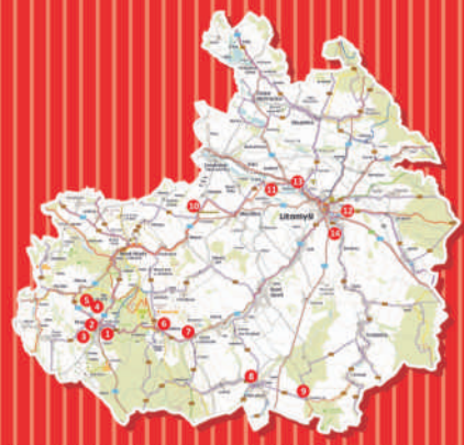
Legenda: 1. lokalita, 2. územní plán, 3. les, 4. studánka, 5. rybník, 6. přírodní památka, 7. památkový areál, 8. A - zastávka a zastavovací místo, 9. obchodní, 10. P - učiliště, 11. C - zastávka, 12. K - školní budova