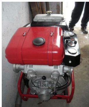
SDH Sedliště, „Pořízení stříkačky“