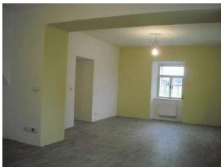
Římskokatolická farnost Proseč „Multifunkční sál“

Příklady zrealizovaných projektů naleznete na www.mas-lit.cz/fotogalerie