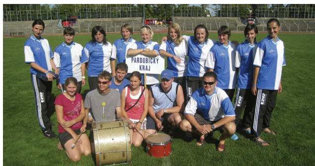
družstvo žen na MR v Ostravě