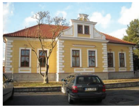
Zdravotní středisko Morašice „Oprava 2. etapa“