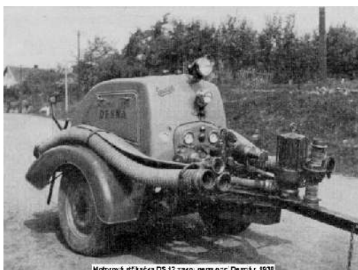
Motorová zážkačka DS 12 z roku 1938. Desná r. 1938

Na letošní rok připadá již 70. výročí založení Sboru dobrovolných hasičů v Desné. Je to jeden z nejmladších sborů na Litomyšlsku. Při příležitosti tohoto výročí je připravováno kratší písemné zpracování o hasičském hnutí v obci, o nezištné práci našich předků, o vzájemné pomoci a povinnostech při požáru a jiných živelných pohromách, ale i o současné činnosti včetně sportu.