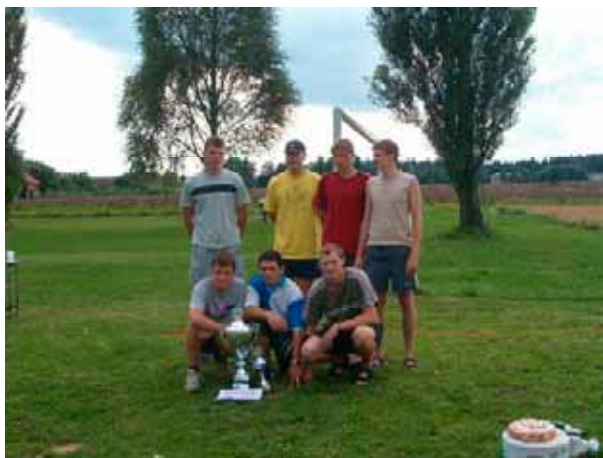
sestava vítězného družstva mužů při desenském poháru